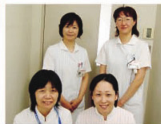
「いはらの里」スタッフ

5月上旬の開設に向けて準備を進めています。特養は利用する方にとって、生活する場所です。居心地よく暮らしていただけるよう、病院の付帯施設である特徴を生かして、地域の方のお役に立てるように頑張っていきます。