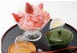
本気のかき氷(7～9月販売)