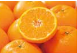
旬の農産品がズラリ!