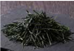
清水のお茶がせいぞろい!